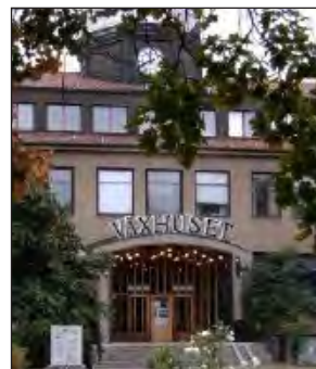
Växhuset, där turneringen spelas, är ett kulturcentrum beläget mitt i stan, precis bredvid spelarhotellen.