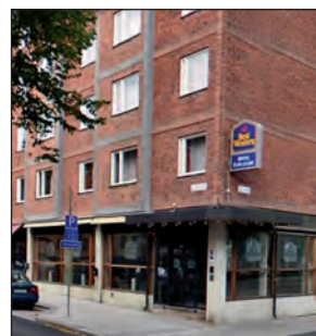
Hotel Esplanade håller hög standard och receptionen har öppet dygnet runt.